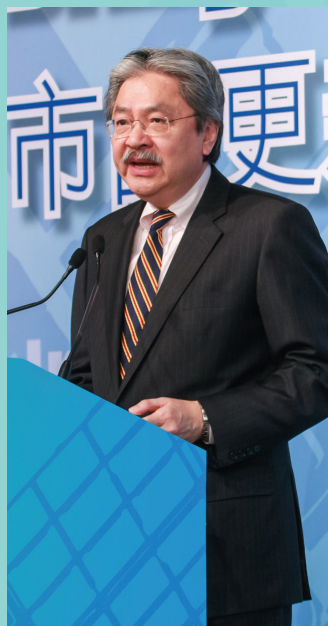
曾俊華先生主持研討會的開幕致辭。