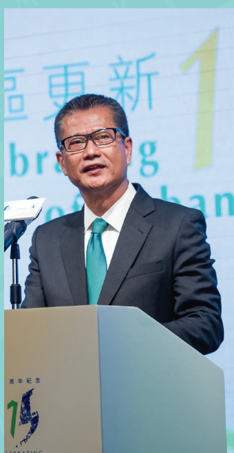
陳茂波先生於酒會上致辭。