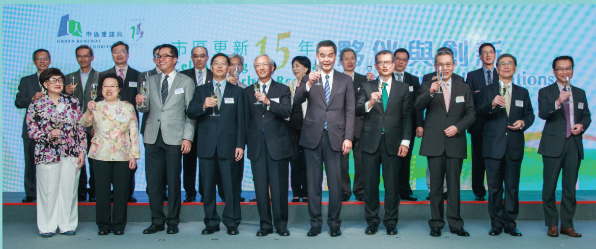
行政長官梁振英先生與眾嘉賓於酒會上祝酒，慶祝市建局十五周年。

我們對市建局的工作成果，感到驕傲。這些成果亦有賴各夥伴及持份者一直以來的支持。為表謝意，我們舉行「市區重建局十五周年酒會」，由行政長官梁振英先生、發展局局長陳茂波先生及市建局主席蘇慶和先生一同主禮，超過二百位嘉賓蒞臨，包括政府部門、立法會議員、區議員、發展商、專業人士、學者及非牟利機構代表等。酒會上有展覽及短片展示市建局過去十五年的工作。