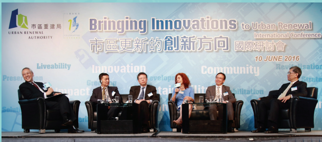
■ 小組討論探討樓宇復修的新方向。

適逢十五周年，本局特別於六月十日舉辦一個國際研討會，主題為「市區更新的創新方向」。研討會雲集來自世界各地包括新加坡、美國、日本、莫斯科、廣州的專家及本地的學者，分享對有關議題的見解和經驗。研討會由署理行政長官曾俊華先生主持開幕，超過二百位城市規劃及建築界的人士參與。