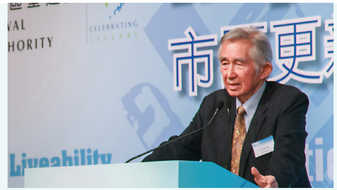
■ 劉太格博士（新加坡）