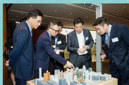
市建局職員透過模型講解小社區發展模式。