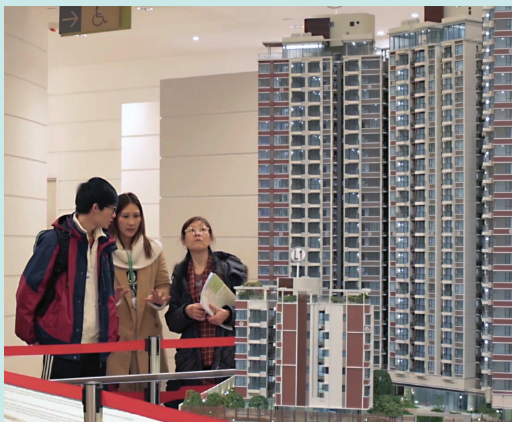
■ 「煥然壹居」資助出售房屋計劃展開售樓程序。