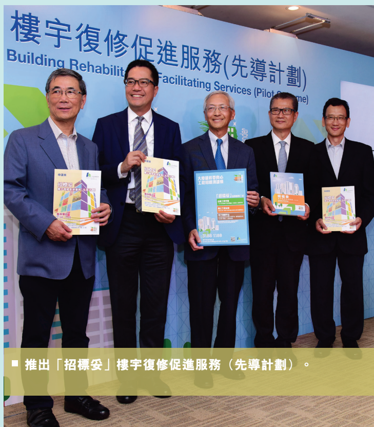
■ 推出「招標妥」樓宇復修促進服務（先導計劃）。