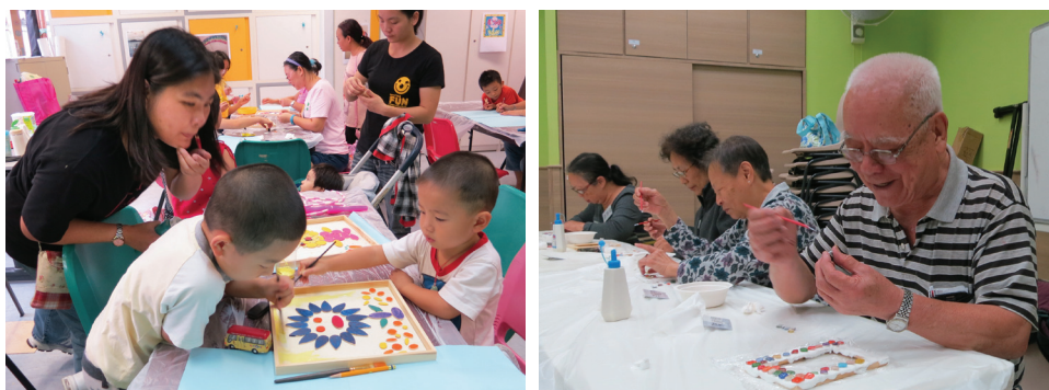
■ 市建局支持舊區藝術文化活動，提升居民生活質素。