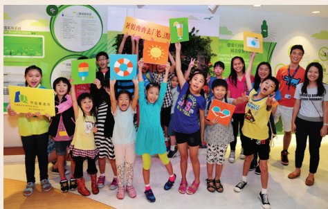
■ 各項教育及外展互動活動讓年輕人全方位了解市區更新。