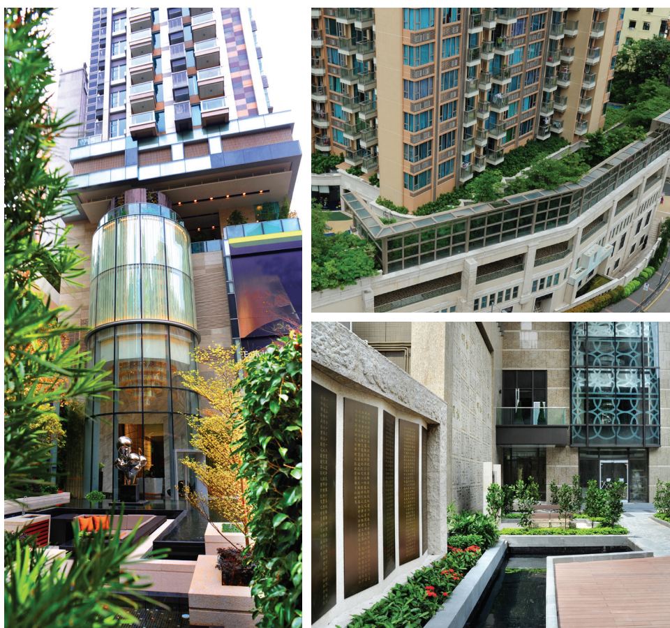
■ 十二個項目包括觀月•樺峯、形品•星寓以及丰匯獲得香港綠色建築議會的環評級別鉑金級證書。