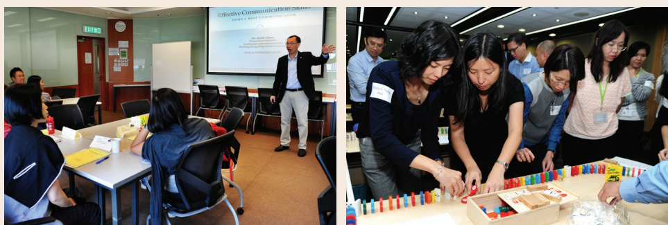
■ 培訓計劃讓員工在能力和心態上裝備，有助建立高效團隊。

本局的薪酬須具競爭力，才得以吸引、激勵及保留合適人才去履行本局使命。為此，本局委託一間顧問公司進行全面薪酬檢討。一個較少層級架構的建議獲本局接納並予以執行。為促進部門之間在新組織架構下的溝通和合作，本局已就辦公室佈局作出檢討和改進，亦已完成部門的遷置，以提高運作效率。