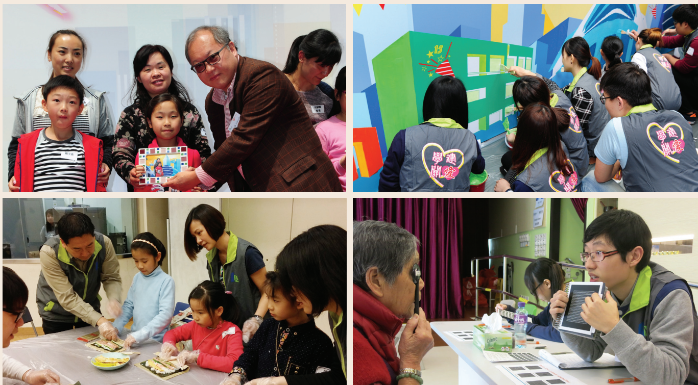
■ 一系列「學建關愛」活動為舊區居民送上關愛。