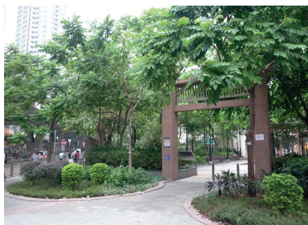
大角咀的街道美化工程。

第一期及第二期活化工程，即櫛樹街及櫻桃街迴旋處改善工程，均已竣工；第三期活化工程涉及數條街道，亦取得良好進展。其中位於福全街與大角咀道第一階段的改善及綠化工程經已完成；而位於福全街、松樹街及洋松街的第二階段工程合約已於二零一四年二月批出，預計可於二零一五年年底完工。