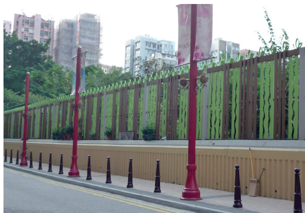
旺角的街道改善工程。

本局現正為五條主題街道進行改善工程，包括花墟道、通菜街、洗衣街、花園街及奶路臣街，以加強地