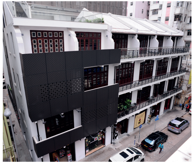
茂蘿街／巴路士街項目及其獲得的獎項：