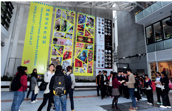
「動漫基地」吸引不少本地及海外漫畫迷到訪參觀。

香港藝術中心目前負責營運茂蘿街／巴路士街活化項目，以「動漫基地」為主題，為本地與世界各地動漫藝術提供交流平台。自項目於二零一三年完成並於同年七月正式開幕，「動漫基地」已廣受公眾歡迎。截至二零一四年三月底，訪客人數已接近二十五萬人次。本局持有該項目的擁有權，並會繼續監督項目的營運。過去一年，項目榮獲多個專業學會的獎項，表揚項目在創新、文物保護、設計及活化再用等各方面的卓越表現。