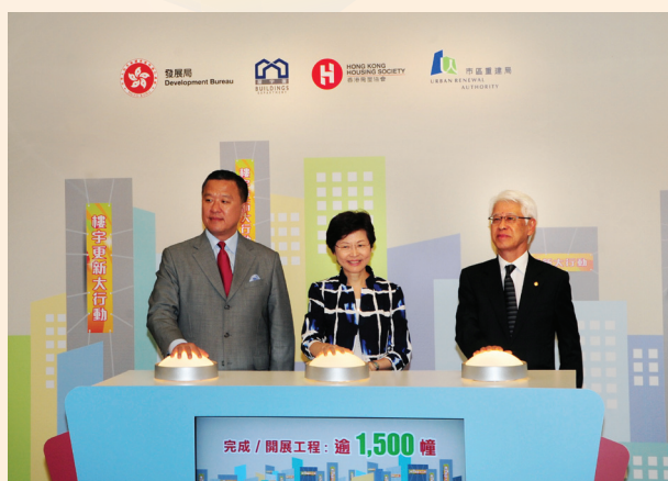
(左起) 市建局主席張震遠先生、發展局局長林鄭月娥女士及香港房屋協會主席楊家聲先生主持「樓宇更新大行動」三周年紀念儀式。

「樓宇更新大行動」是一項由政府推行的一次性特別措施，目標是為建造業界創造更多就業機會及推廣樓宇安全。本局自二零零九年一直全力支持該項計劃。截至二零一二年三月底，本局已為約一千三百三十六幢樓宇，六萬二千個單位的業主提供財政及技術支援。在二零一一／一二年度，本局在樓宇復修服務區內，已協助約二百八十幢樓宇，涉及約一萬一千九百個單位，進行樓宇復修工程。預計「樓宇更新大行動」需時多兩至三年完成。