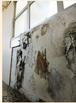
油麻地翠園大廈復修前後的面貌。