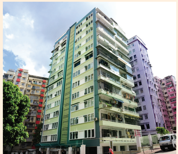
觀塘華豐大廈復修後的新面貌。

自二零零四年起，本局透過物料資助計劃及免息貸款計劃，協助業主進行樓宇復修。截止二零一一年三月底，約五百五十幢樓宇約四萬四千個單位的業主受惠該兩項計劃。由二零一一年四月一日起，本局聯同香港房屋協會（房協）合作重新整合一套統一而全面的