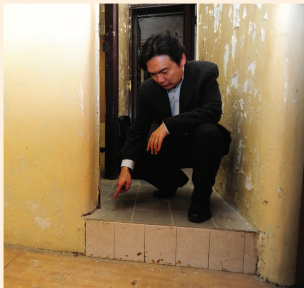
市建局職員檢查樓宇狀況。

本局將逐步接手房協的樓宇復修工作，預計於二零一三年擴展服務範圍至整個九龍地區，並於二零一五年擴展至全港。由於擴大的服務範圍將遠超於本局現時的服务區，我們已制定一個初步策略，以應付未來擴展的覆蓋範圍，包括增聘人手和設立新辦事處。