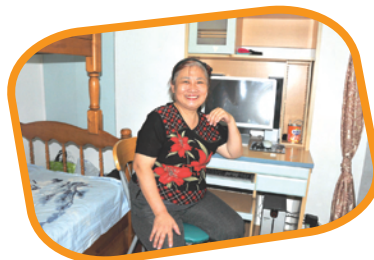
李女士對曉光街的新居感到滿意。