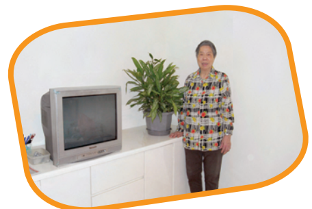
李婆婆已入住位於藍田的新居。

上表是根據市建局對 百二十五名自住業主的訪問結果。市建局正對受項目影響的居民，進行深入的追蹤調查。