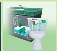
污水處理循環再用系統