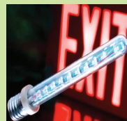
公共地方： 先進省電照明設備